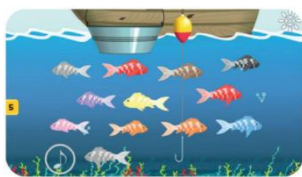
Таблица игр «Английский язык»